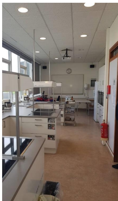
Mynd 7 Eldhús fyrir kennslu í heimilisfræði