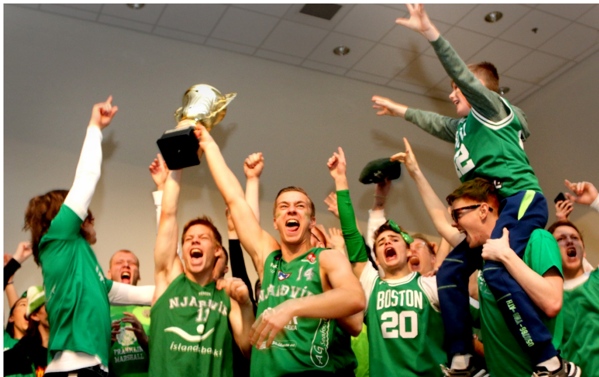
Græna liðið vann Starfshlaupið.