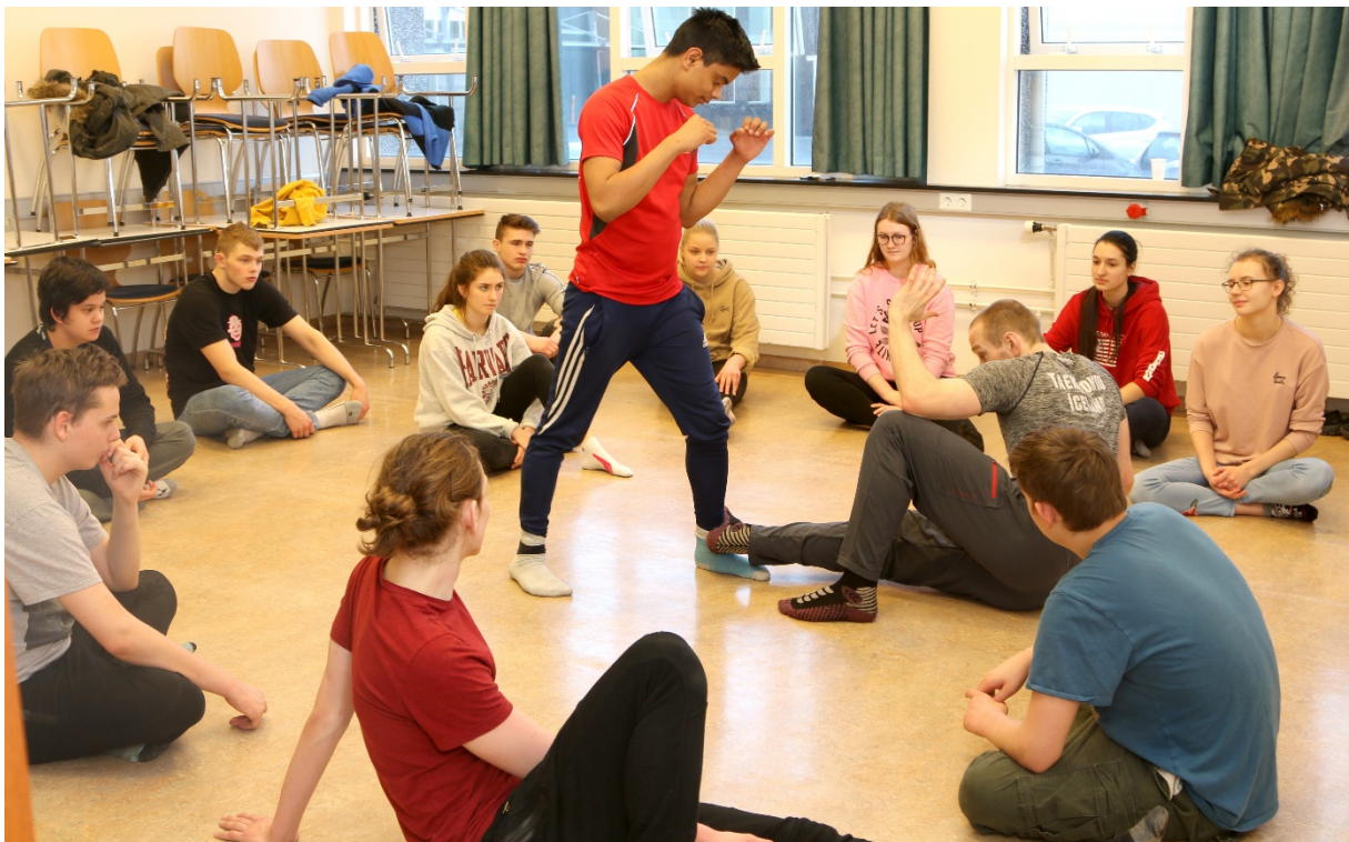
Frá þemadögum á vorönn.

Á upplýsingablaði sem nemendur skiluðu inn voru þeir einnig beðnir um að gera grein fyrir því hver óskaði eftir þjónustu fyrir nemandann, þar sem hægt var að velja eitt eða fleiri af eftirfarandi; nemandinn sjálfur, foreldri/forráðamaður eða starfsmaður skólans. Þegar ofangreindar upplýsingar voru teknar saman kom fram að um 90% nemenda greindu frá því að þeir óskuðu sjálfir eftir þjónustunni. Hér er þó mikilvægt að hafa í huga að starfsmenn skólans, einkum náms- og starfsráðgjafar aðstoðuðu nemendur oft við að óska eftir viðtölum hjá sálfræðiþjónustu skólans.