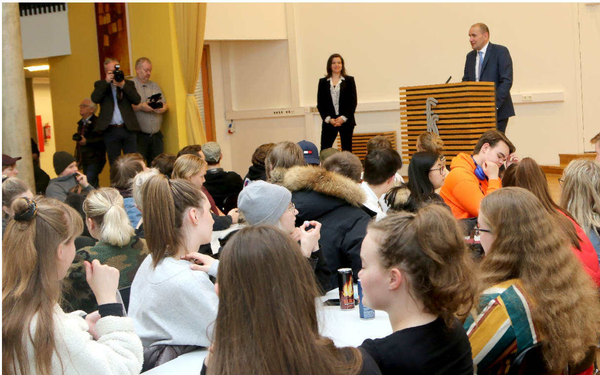
Frá heimsókn forsetahjónanna.

Þann 2. maí komu forsetahjónin hr. Guðni Th. Jóhannesson og Elíza Reid í heimsókn í skólann. Heimsóknin var liður í opinberri heimsókn forsetahjónanna í Reykjanesbæ 2. og 3. maí. Kallað var á sal þar sem forsetinn ræddi við nemendur og svaraði nokkrum spurningum. Forsetahjónin ræddu einnig við nemendur og starfsmenn skólans.